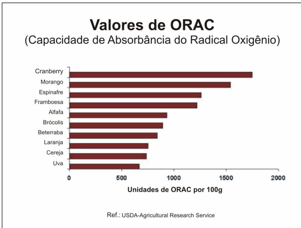
Gráfico 3: Valores de ORAC (Capacidade de Absorbância do Radical Oxigênio) em diversas frutas e vegetais.